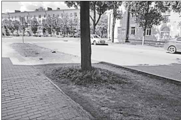
Эта пыльная земля на Козьмодемьянской считается газоном

Землевание заключается в равномерном поверхностном покрытии газонов смесью хорошо перепревших органических удобрений (перегной, компосты) и крупнозернистым песком (до 30%) слоем 2 - 3 мм. Землевание рекомендуется регулярно проводить на партерных (один раз в 3 - 4 года) и спортивных (2 - 4 раза в течение вегетации) газонах. Норма расхода смеси - 800 г/кв. м, время - весна - начало лета (в пе-