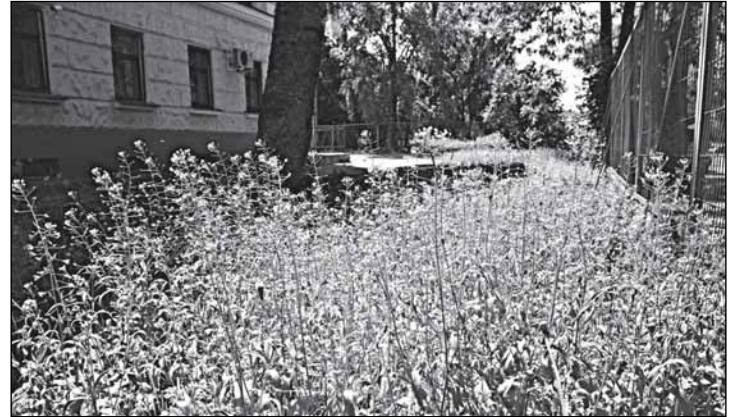
Состоятельность не гарантирует порядка. Двор «Новгородэнерго»: там, где нет ухода за травой, царит неряшливая пастушья сумка

3.2.4. При борьбе с сорной растительностью наиболее эффективны приемы профилактического характера: уничтожение сорняков при обработке почвы,