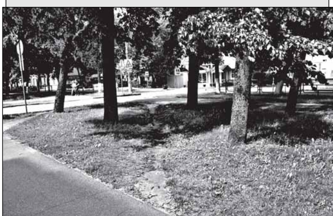
Газон рядом с Домом Советов. О таких случаях в «Правилах» говорится: «3.2.16. Места, поврежденные после зимы или вытопанные, необходимо вскопать на глубину 20 см, почву разровнять, внести удобрения, посеять заново семена газонных трав и полить». «3.2.17. Случайные дорожки или затопанные бровки газонов лучше всего одерновывать, чтобы скорее получить травяной покров». В крайнем случае можно и легализовать стихийные тропки, их замостив.