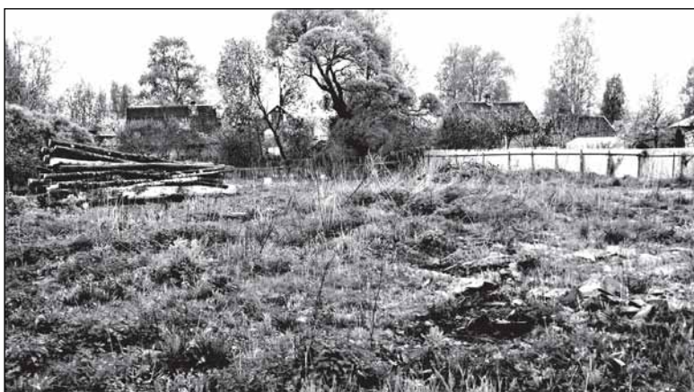
А от дома по Революции, 65 не осталось ничего