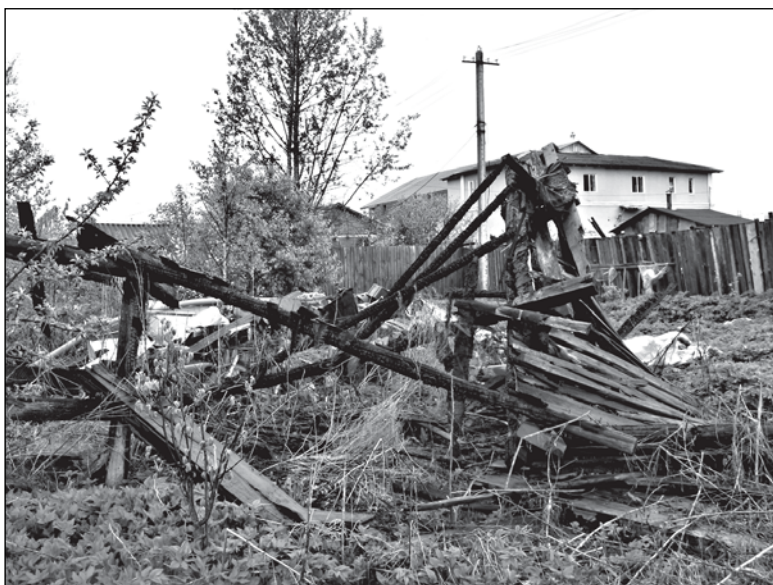
...и по Красноармейской, 13