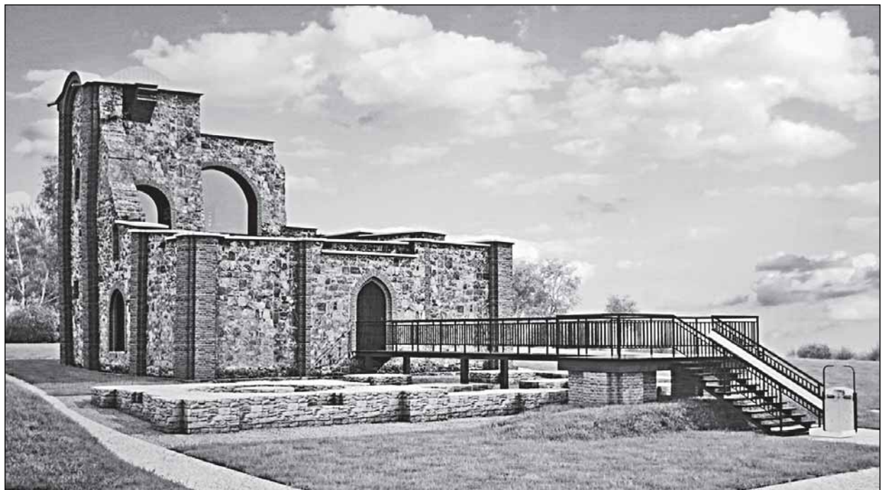
Будет - так (проект консервации ООО «Март»)

- Десять лет прошло с начала проектных изысканий, и это уже не первые работы, которые здесь проводятся, вы видите, из руин торчат металлические связи – это то, что было сделано в рамках последней консервации, – рассказывает заместитель генерального директора Новгородского музея-заповедника