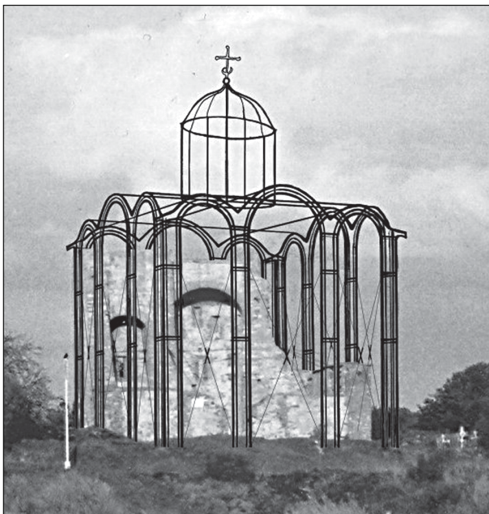
Так - не будет (контурная реконструкция Ирины Очиной)

На Рюриковом городище начинается реализация проекта реставрационных работ с консервацией руин церкви Благовещения на Городище и их приспособлением для экскурсионного показа. Сейчас здесь идёт обустройство строительной площадки.