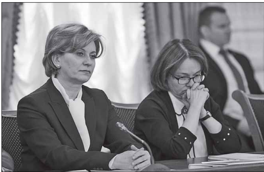
Анна ПОПОВА и Эльвира НАБИУЛЛИНА на заседании президиума Госсовета

- Тема, которая сегодня обсуждалась, касается буквально каждого жителя Российской Федерации и гостей нашей страны, - сказала она. - Потому что потребитель является каждый из нас в любое время в течение суток. Мы все пользуемся товарами, пользуемся услугами. И на сегодняшнем заседании было неоднократно отмечено, что прошёл 25-летний этап с момента принятия закона о защите прав потребителей в РФ. Хочу отметить, что это был один из первых законов в новой Рос-