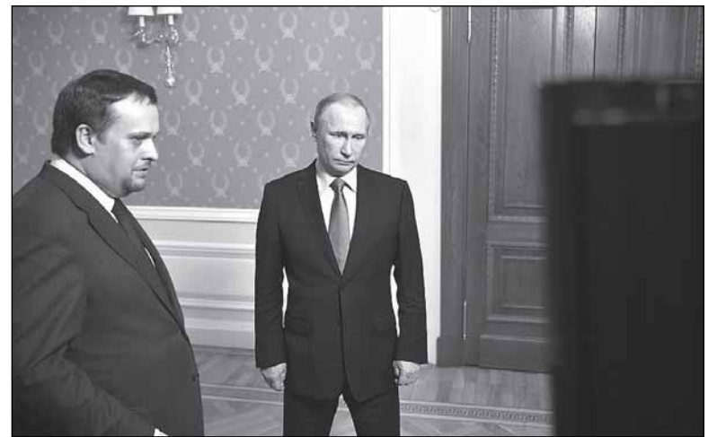
Андрей НИКИТИН знакомил президента с проблемами области не на пальцах, а на слайдах

- У нас более 50% воды не соответствует нормативам. И тоже постепенно мы будем, естественно, формировать концессию. Понятно, что концессионер хочет зайти в крупные города и не хочет заниматься сёлами, и мы сейчас будем